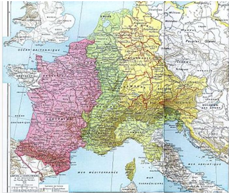
Verdeling van het Frankische Rijk bij het Verdrag van Verdun (843):