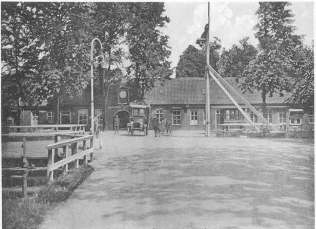
Veenhuizen. "De oude Poort."