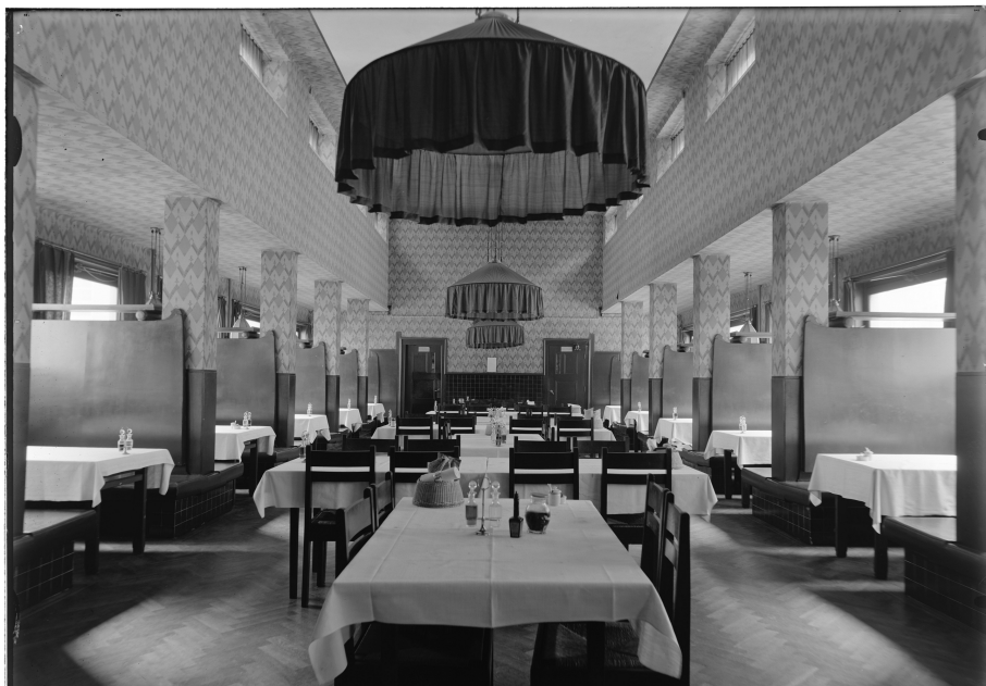
Amstelland #135, november 2024