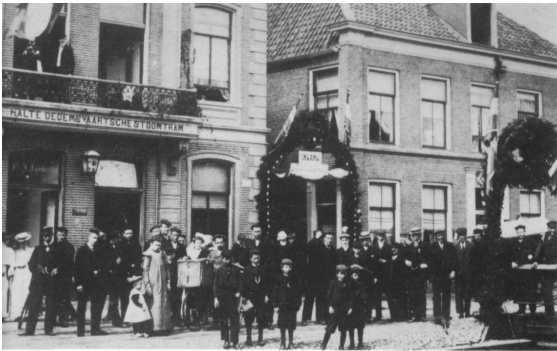
Hotel Thomas, tegenover de Hoofdstraatkerk, met het Thomasbrugje. Hier was een halte van de D.S.M. (Dedemvaartsche Stoomtram Mij). Later was hier Zomer Zelfbediening (nu Doldersum) gevestigd.