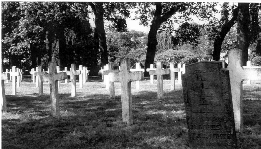
(Het katholieke gedeelte van het kerkhof “ Veenhuizen IV”)

Het meest echter werd Veenhuizen een wekerende basis voor Derk Harmen. Hij verdiende de kost als arbeider en was dus armlastig. Nadat hij vanuit Dedemsvaart terugkeerde naar het noorden, was hij enige jaren kolonist in Veenhuizen, eerst in het derde gesticht, later in het eerste. In de geboorteaktes van zijn daar geboren kinderen staat vermeld: ‘tijdelijk verblijf houdende te Veenhuizen, woonachtig te Leeuwarden’.