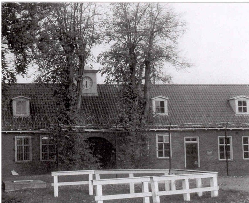
(Buitenzijde van een gesticht met woningen)

echt oud, maar hij zou toch zo langzamerhand met pensioen kunnen. Normaal gesproken zou hij dan een woning in zijn thuisbasis Leeuwarden hebben gezocht om daar met vrouw en kinderen een huishouding op te zetten. Militairen hadden geen vast adres, een regiment bleef maar een paar jaar in één plaats. De gezinnen trokken mee en betrokken in de nieuwe verblijfplaats weer een andere tijdelijke woning, een kamer in een kazerne of bij particulieren. Hij zou helemaal opnieuw hebben moeten beginnen en dan, als je opgegroeid bent in een militaire gemeenschap, zal de burgermaatschappij niet meevallen. Er deed zich echter een andere mogelijkheid voor. Sinds de gestichten van de Maatschappij van Weldadigheid (M.v.W.) bestonden, was er voor veteranen de mogelijkheid zich daar verdienstelijk te maken. Het voordeel was dat men eigen woonruimte had en het traktement zou behouden, zoals in de literatuur over de M.v.W. te lezen is. Dat van het traktement lijkt me twijfelachtig, de geraadpleegde archieven geven een heel andere indruk. Of de plaatsing helemaal vrijwillig was, is niet bekend.