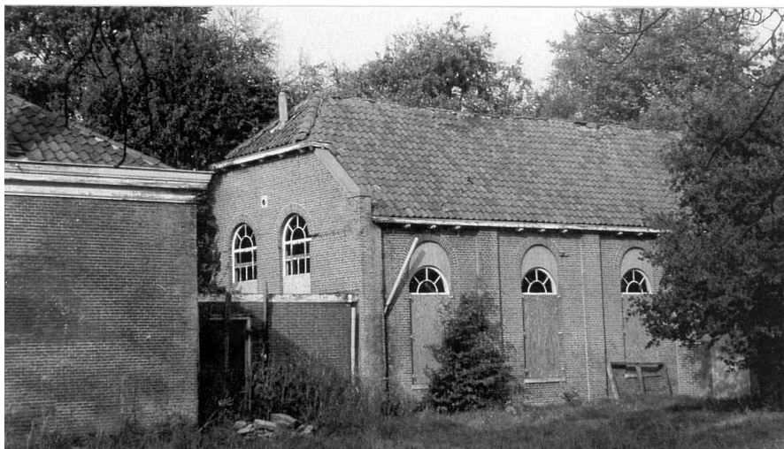
(Resten van het derde gesticht, Veenhuizen III)

De veteranengezinnen woonden in de huisjes aan de buitenzijde van de gestichten, 'dus aan de goede kant' zoals wordt gezegd. Deze woningen waren door een muur gescheiden van de zalen voor de verpleegden. Men moest buitenom en door de poort om aan de binnenzijde van het gesticht te komen. De taak van de veteranen, die onder leiding van een officier stonden, was helpen de orde te bewaren. Daarnaast konden ze dus vrijwillig werken op het land of in de fabrieken, samen met de verpleegden. De kolonie was zoveel mogelijk zelfverzorgend en naast landbouw, een bakkerij, slagerij, enz. waren er verschillende kleine industrieën bij de gestichten, zoals een meubelmakerij en een stoomspinnerij.